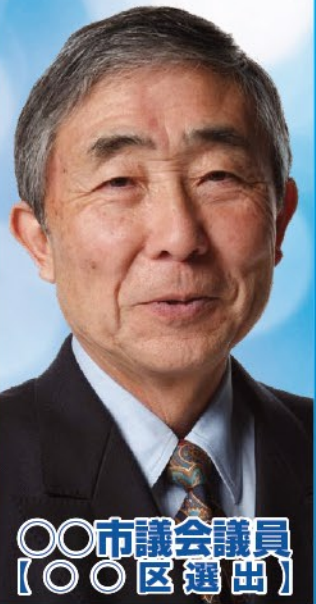
〇〇市議会議員 〔〇〇区選出〕